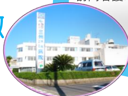
医療法人 倫生会 三州病院