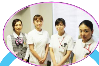
訪問看護ステーション“もも”