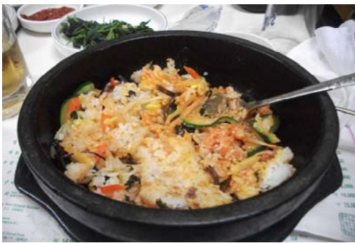
定番の石焼ビビンバ