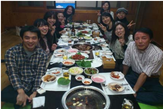
女性陣の食べっぷりに男性陣はア然