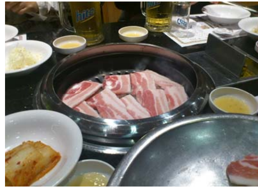
女性陣をうならせたデジカルビ