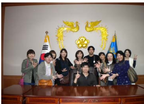
韓国だけど、Yes We Can