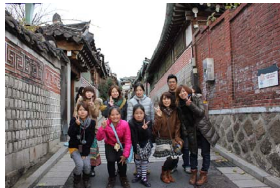
ハイチーズじゃなくて「キ・ム・チ～」