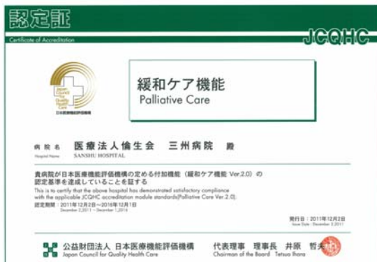
付加機能審査(緩和ケア)認定証