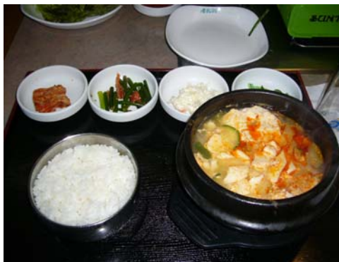
最後の食事はスンドゥブ(辛)