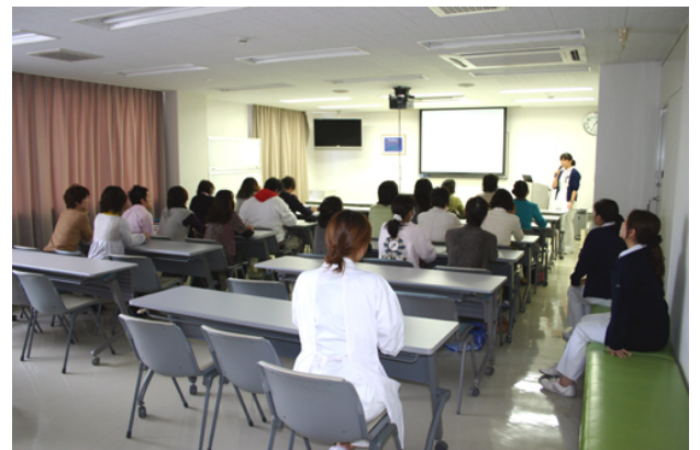
都城地域在宅勉強会