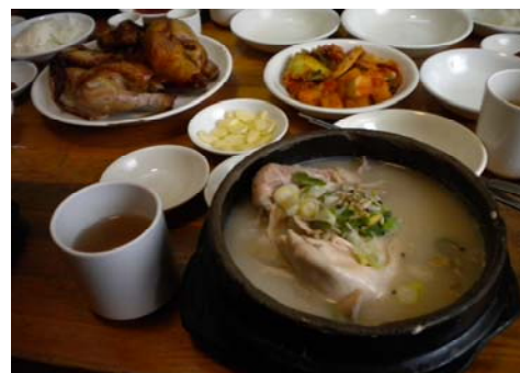
本場の名店の味、サムゲタン